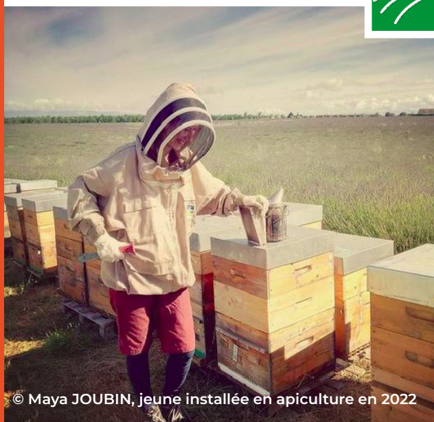
© Maya JOUBIN, jeune installée en apiculture en 2022

Foncièrement engagés, foncièrement humains.