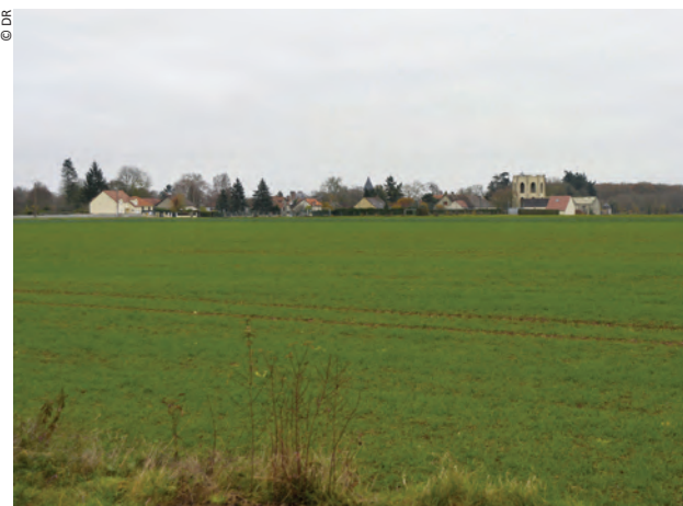
Les espaces agricoles de Forges (77)

Pour garantir à long terme la pérennisation des espaces ouverts, la Safer vous accompagne dans la mise en place des périmètres de protection (Zone Agricole Protégée, Périmètre de Protection des Espaces Naturels et Agricoles Périurbains...).