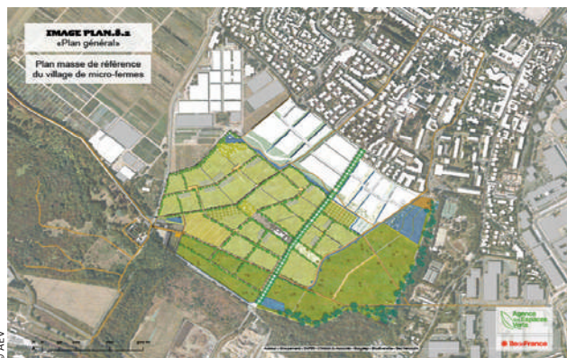
Etude de faisabilité d'un projet agricole de proximité - Plaine de Montjean (94) AEV / LANTON-SAFER-BURGEAP

Notre équipe est à votre disposition pour étudier vos projets d'accompagnements d'installations agricoles de proximité (circuits courts, maraîchage, petit élevage, points de vente locaux...), tant d'un point de vue de la faisabilité technique, du portage foncier et financier que sur la recherche de porteurs de projet.