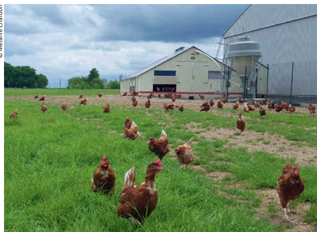
Financement d'un atelier de poules pondeuses, Ferme des Galaches à Chaintreaux (77)

Notre équipe accompagne les territoires dans leurs réponses aux appels à projets portant sur des dispositifs de soutien au développement local et à l'agriculture. Pour ce faire, elle met à disposition sur les territoires, des collaborateurs détachés pour l'animation locale : émergence de projets, recherche de financements... Par exemple, l'animation du Leader Seine Aval, assurée par la Safer depuis 2007, a permis de développer les circuits courts, de créer des logements étudiants à la ferme... Le territoire a ainsi bénéficié de 2,3 million d'euros de crédits européens.