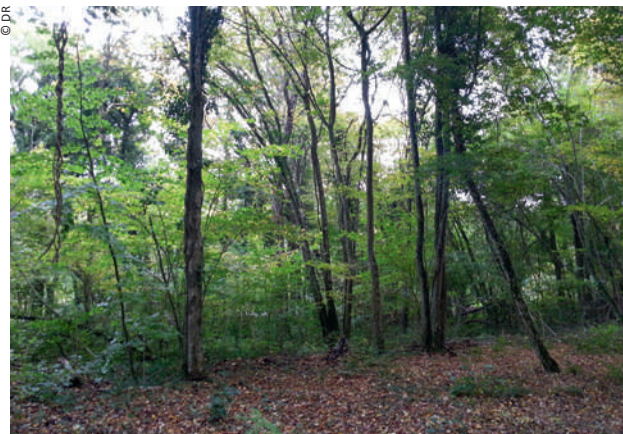
Parcelles maîtrisées par la commune de Mézy-sur-Seine (78)

Pour remettre en valeur des espaces en friches ou dégradés, notre équipe vous accompagne dans les procédures dédiées et vous conseille dans les dispositifs de lutte contre les dégradations et les atteintes à l'environnement (Biens vacants Sans Maître, procédure lutte contre les friches,...).