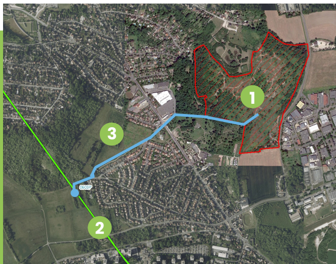
Situation du site