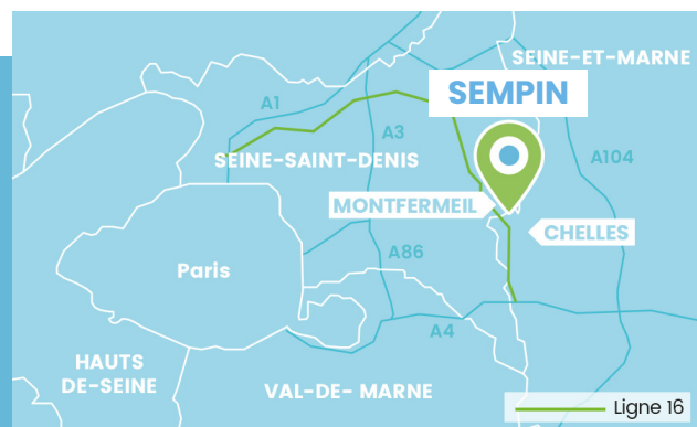
Localisation du site en Île-de-France

En 2012, la SAFER de l'Île-de-France a acquis auprès du groupe Saint-Gobain un ensemble foncier de 120 ha, situé à l'intersection des communes de Chelles, Gagny et Montfermeil, en limite des départements de Seine-et-Marne et de Seine-Saint-Denis.